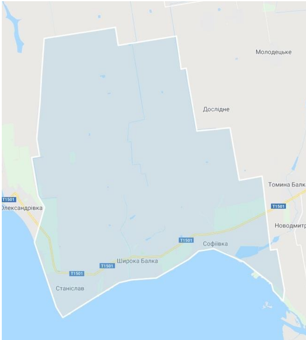
Малюнок 1: Карта з зазначенням основних населених пунктів Станіславської ОТГ